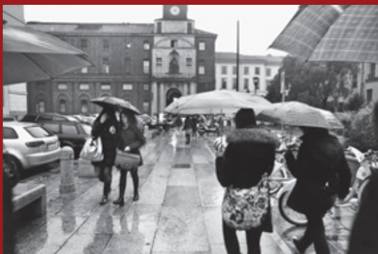
Università Cattolica, Milano, 2009.