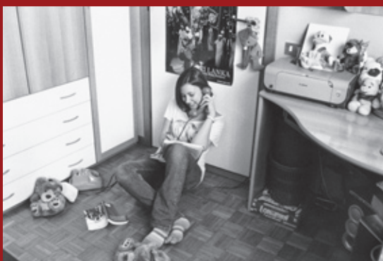
Cusano Milanino, 2009.