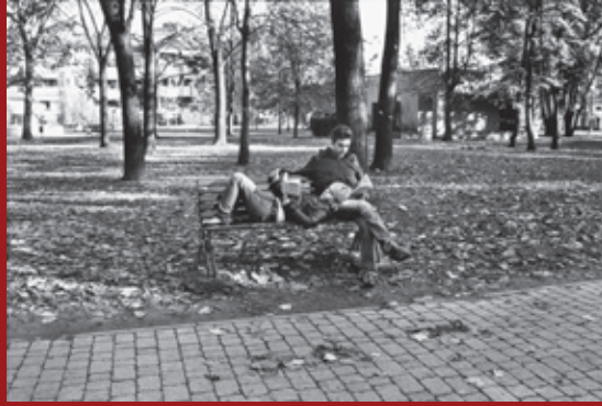
Cusano Milanino, 2009.