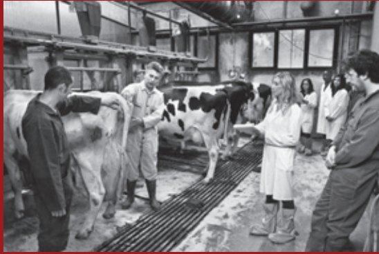
Università Cattolica, Piacenza, 2009.