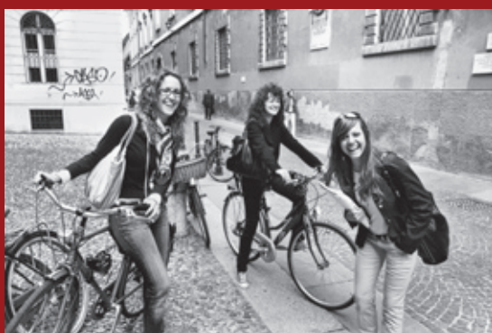
Università Cattolica, Brescia, 2009.