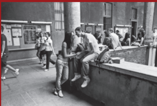
Università Cattolica, Milano, 2009.