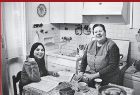
Cusano Milanino, 2009.