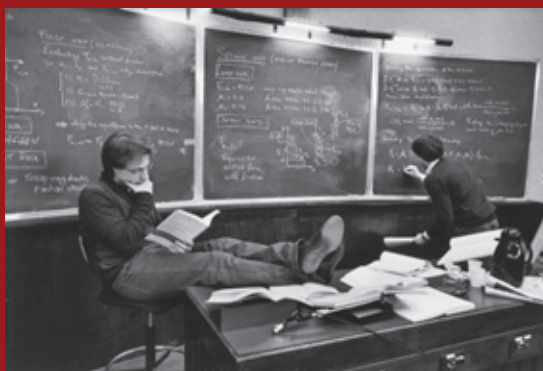
Università Cattolica, Milano, 2009.