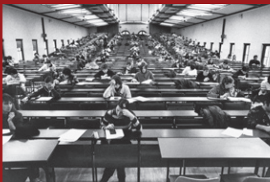
Aula Gemelli, Università Cattolica, Milano, 2009.